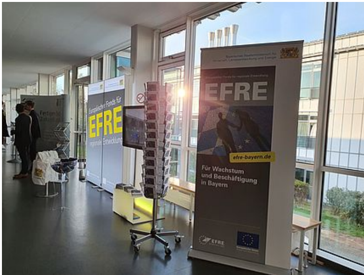
EFRE-Stand beim 2. EU-Tag der Universität Bayreuth